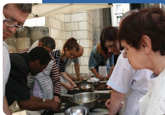
Atelier de cuisine "Tours de bulles"

Le festival "Tours de bulles" ou festival de BD de Tours, du 10 au 14 septembre 2014, avait cette année comme fil conducteur la gastronomie. Engagée depuis plusieurs années à rendre ce festival accessible au plus grand nombre, La ville de Tours a ouvert ses ateliers culinaires aux personnes que nous accueillons. Plus d'une trentaine de résidents du Pôle Soins et du Pôle Habitat ont donc pu participer à la création d'un plat ou d'un dessert tout au long de la semaine. Orchestrés par un chef cuisinier, les ateliers, ouverts à tous, ont permis la rencontre entre le monde ordinaire et le monde du handicap dans une ambiance conviviale.