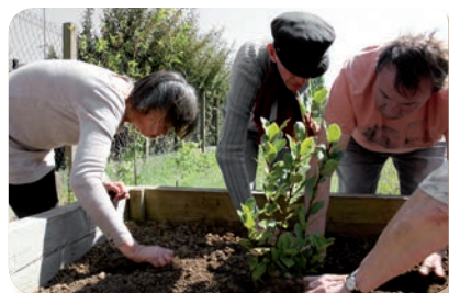
Au jardin solidaire du Sanitas

Découverte de différents spectacles comme " La mélancolie des dragons " dans différents lieux culturels (CDRT, Théâtre...).