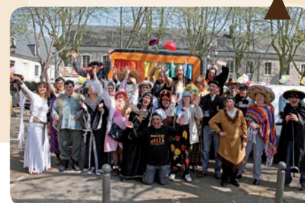
Le carnaval bat son plein !