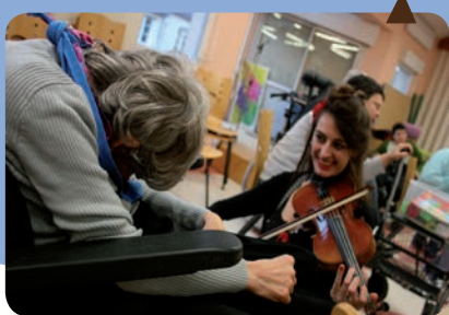
Les artistes de Souricat

Durant plusieurs séances, les deux musiciens sont venus jouer au plus près des résidents et ont terminé leur intervention par un concert, à la plus grande joie de tous !