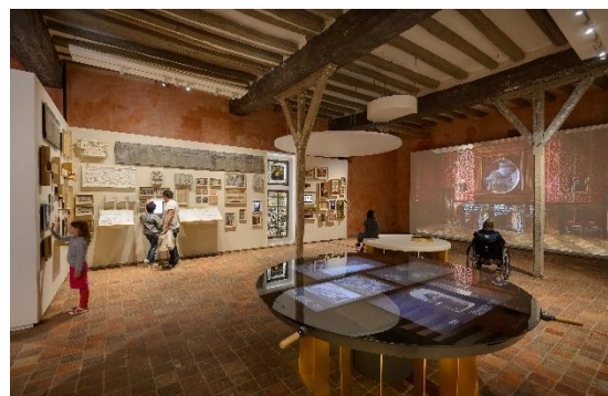
Le pressoir