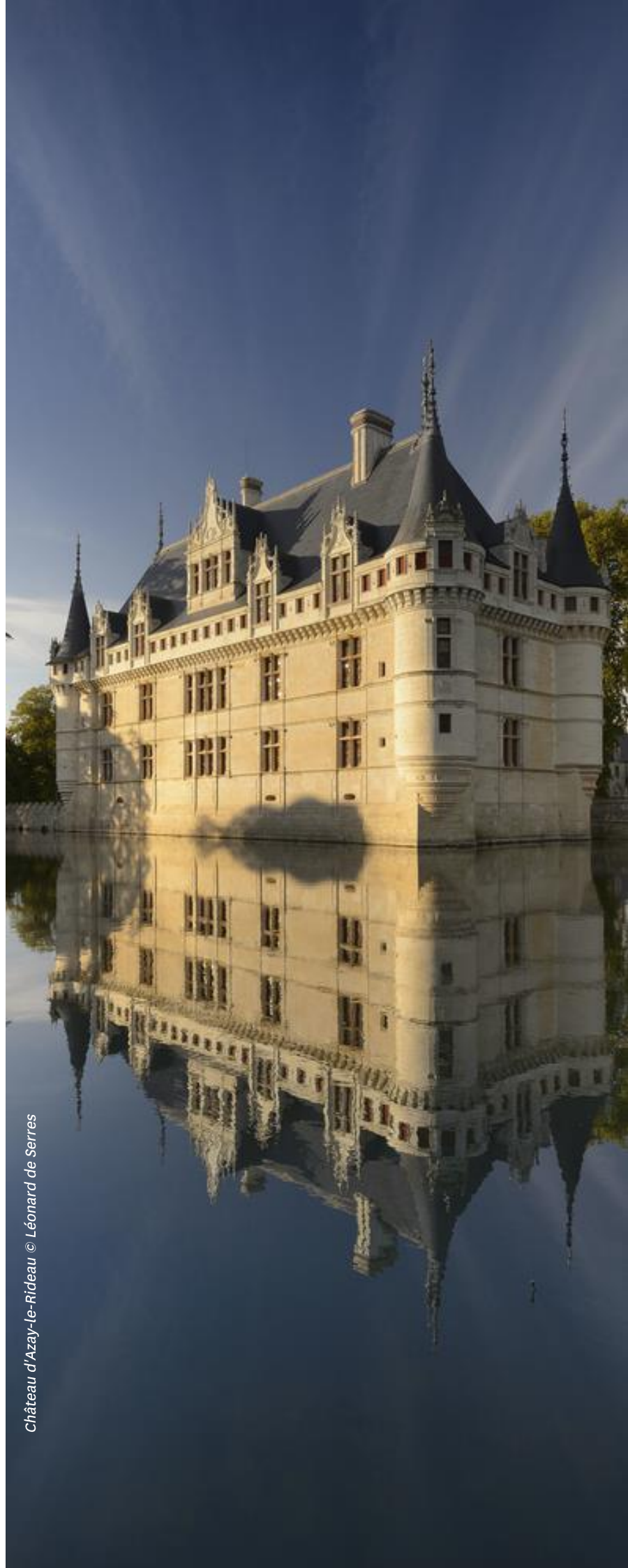
Château d'Azay-le-Rideau