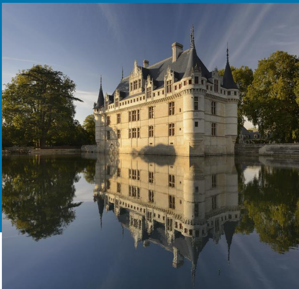
Château d'Azay-le-Rideau

Le vendredi 25 et le samedi 26 avril 2025