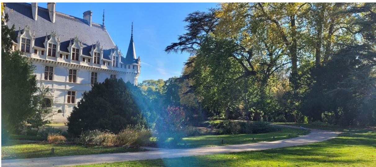
Parc paysager

Nombre de places limité : 10 personnes en situation de handicap et accompagnateurs compris.