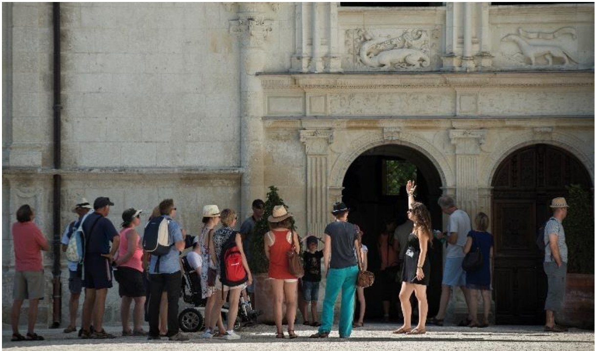
Visite d'accueil du château

Sur inscription à l'accueil et sous réserve de disponibilité des agents d'accueil.