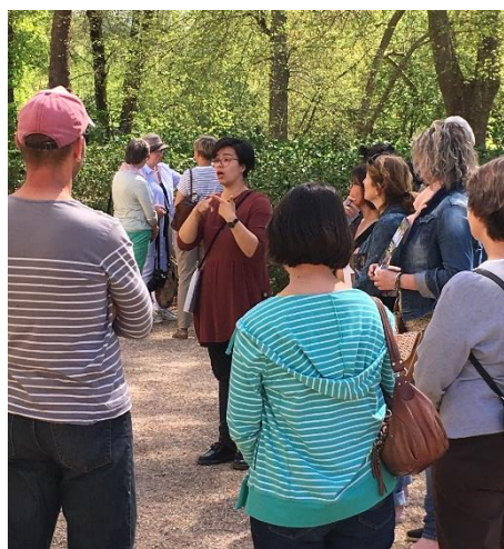
Visite en LSF du château

Nombre de places limité : 20 personnes en situation de handicap et accompagnateurs compris.