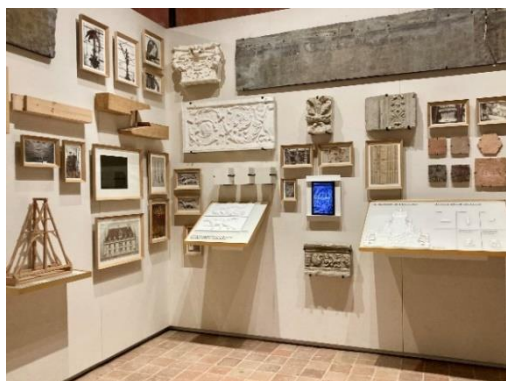
La matériauthèque

Installé dans l'ancien pressoir, le centre d'interprétation est un espace accessible à tous qui propose des contenus adaptés aux personnes en situation de handicap.