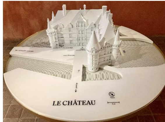
Maquette du château

Nombre de places limité : 20 personnes en situation de handicap et accompagnateurs compris.