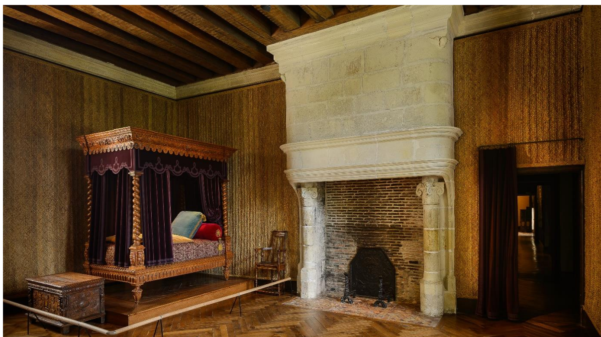
Chambre Renaissance

Nombre de places limité : 15 personnes en situation de handicap et accompagnateurs compris.